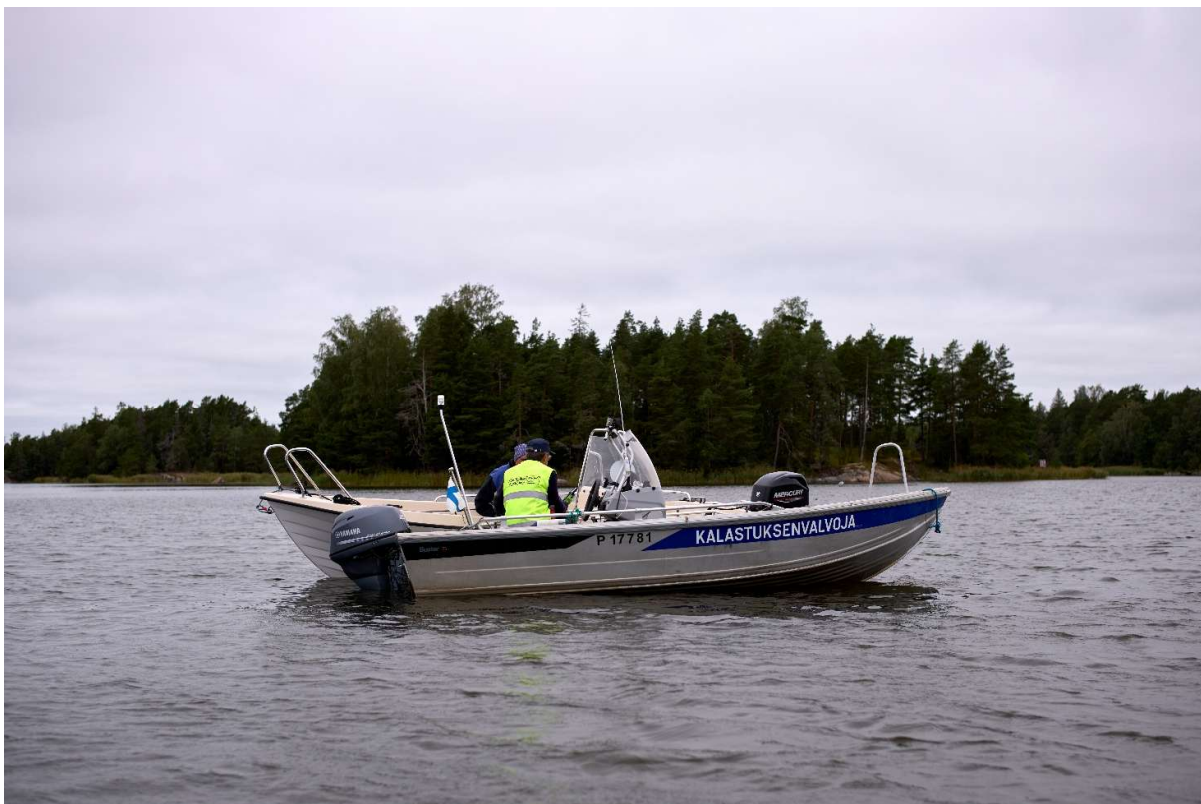
Bild 2: Fiskeövervakare Thorbjörn Sirén på övervakningsrunda under videopoddinspelningen.

Videopodcasten lanserades den 27 september 2025 i samband med seminariet för vattenägare och publicerades på Borgå-Sibbos fiskeriområdes YouTube-kanal (se länkar). Podcasten producerades i både finsk och svensk version.