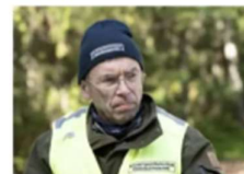
Tjuvfiskare kan komma undan, konstaterar Sirén.