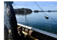
Fiskeövervakarna har händerna bakbundna om inte privata vattenägare ger tillstånd att övervaka lovligheten.