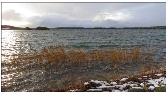
Projektet på samma våglängd vill stärka samarbetet och informationsutbytet inom fiskeriområdet och förbättra dialogen med områdets vattenägare.

Projektet ”På samma våglängd” fokuserar på att stärka samarbete och informationsutbyte inom fiskeriområdet. En av de centrala målsättningarna är att förbättra dialogen