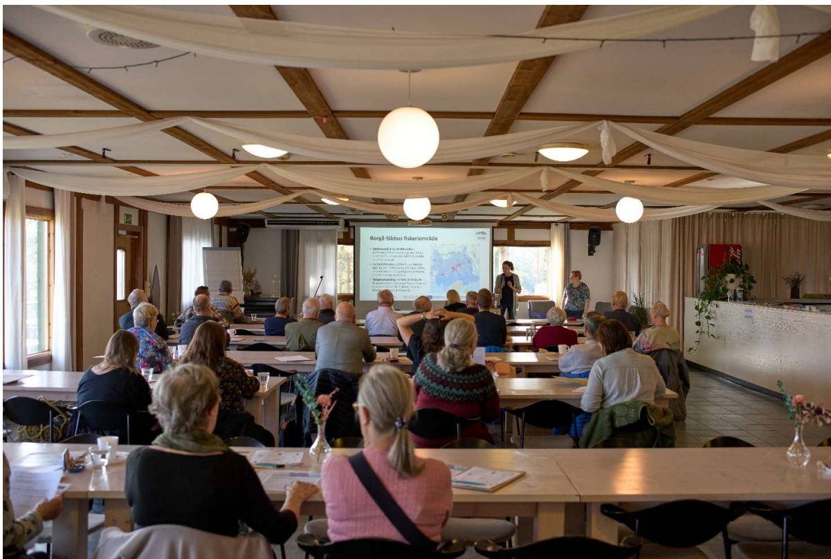
Bild 3: Vattenägarseminariet samlade vattenägare och sakkunniga till diskussion om vattenägande och fiskeövervakning.