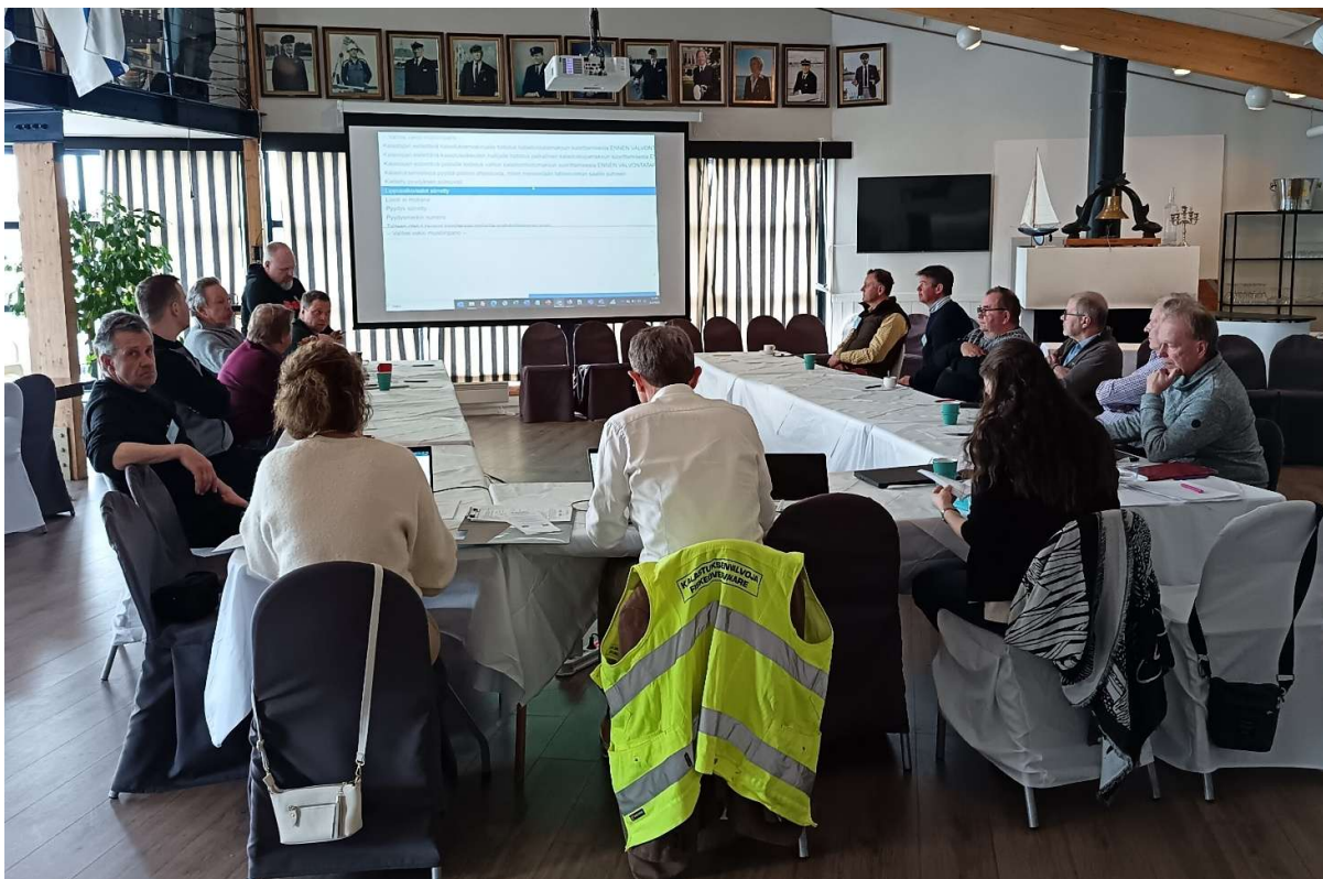
Bild 1: Den Nyländska Fiskeövervakarträffen ordnades den 5 april 2025 på NJK Björkholmen i Helsingfors.

Enligt deltagarfeedback uppfyllde träffen i huvudsak deltagarnas förväntningar. Diskussionerna upplevdes som särskilt värdefulla, medan frånvaron av Polisen och NTM-centralen var det som flest deltagare lyfte fram som en brist. Majoriteten av deltagarna uttryckte också intresse för att delta i liknande tillställningar i framtiden.